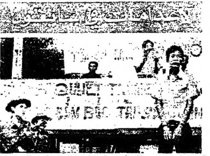
جرت في اسبوعين عمليات اعدام استهدفت بعض المواطنين للحكم